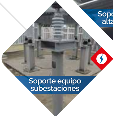
Soporte equipo subestaciones