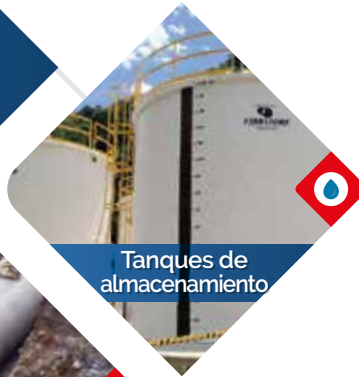
Tanques de almacenamiento