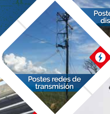
Postes redes de transmisión