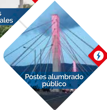
Postes alumbrado público