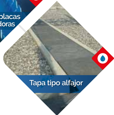
Tapa tipo alfajor

Los tanques satisfacen los requerimientos referenciados en las normas: ASTM D4097 - ASME RTP-1 - ASTM C582 - ANSI B16.5 - ASTM D3299