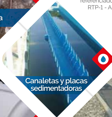
Canaletas y placas sedimentadoras