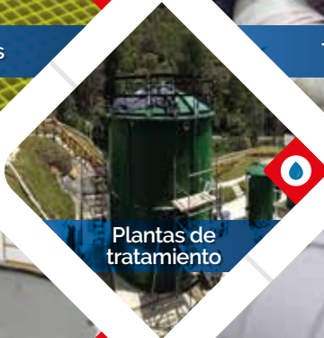
Plantas de tratamiento