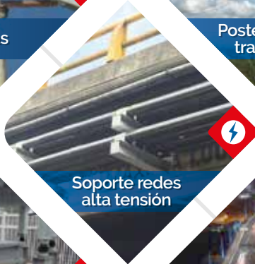
Soporte redes alta tensión