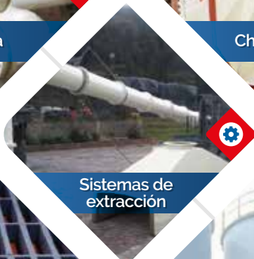
Sistemas de extracción