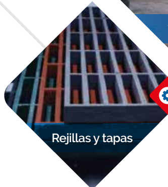
Rejillas y tapas