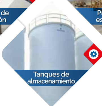
Tanques de almacenamiento