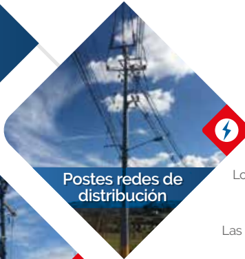
Postes redes de distribución

Los postes satisfacen los requerimientos de RETIE, RETILAP, ASCE 104, ANSI C136.20, ASTM D4923-01, NTC 6275.